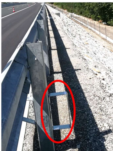
Slika 1: Stopa za prehod čez jekleno varnostno ograjo

b) Elementi za prehod preko jeklene varnostne ograje, ki niso njen sestavni del Na lokacijah cestnih objektov, SPIS portalov in podobnih mestih, kjer se pogosto opravljajo vzdrževalna dela in je postavljena jeklena varnostna ograja, ki je višja od 80 cm, se za varnostno ograjo vgradi element – lestev, in sicer tako, da ne vpliva na karakteristike varnostne ograje – ni pritrjen ali kako drugače fizično povezan z varnostno ograjo (slika 3). Element se ne namešča za varnostno ograjo, postavljeno v ločilnem pasu. Delavniški načrti prehoda – lestve za prehajanje preko JVO so podani v prilogi Navodila. Lestev se postavlja na v zemljino zabite sidrne elemente ali se vijači na betonsko konstrukcijo objekta. V primeru, da na mestu postavitve lestve potekajo podzemne inštalacije (elektrika, optika, odvodnjavanje ...) se lestev pritrdi na armiranobetonski pasovni temelj dimenzije 0,80 m x 0,30 m x 0,80 m.