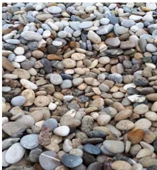
Slika 2: Primer ustreznega materiala