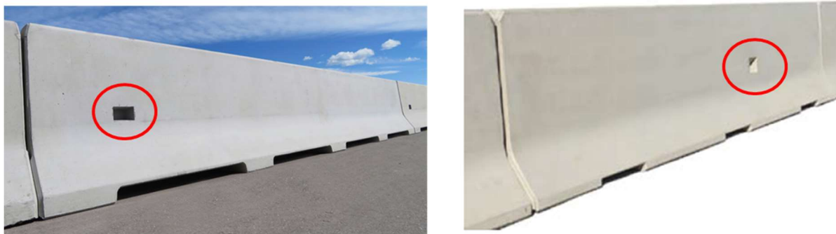
Slika 1: (levo), 1a (desno): Stopnica (utor) za lažji prehod čez ograjo

Za prehod čez jeklene varnostne ograje se na zadnjo stran stebra varnostne ograje pritrdi pravokotnik dimenzij 0,15 m x 0,30 m, kot je prikazano na sliki 2. Element mora biti izdelan iz vroče cinkane pločevine min. debeline 5 mm in širine 55 mm in na steber ograje pritrjen z dvema vijakoma M10x30 s šeststrobo glavo. Matica in podložka morata biti pritrjeni z notranje strani stebra varnostne ograje. Mesto, na katerem je pločevina varjena, mora biti ob stebru varnostne ograje. Elementi za prehod čez varnostno ograjo se nameščajo na medsebojni razdalji, ki ni večja od 48 do 50 m.