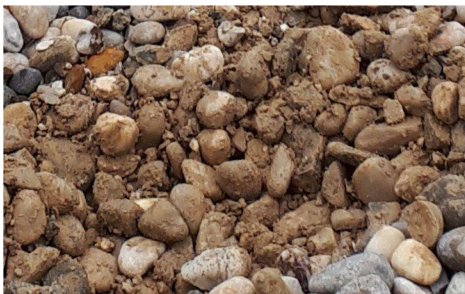
Slika 3: Neprimeren material