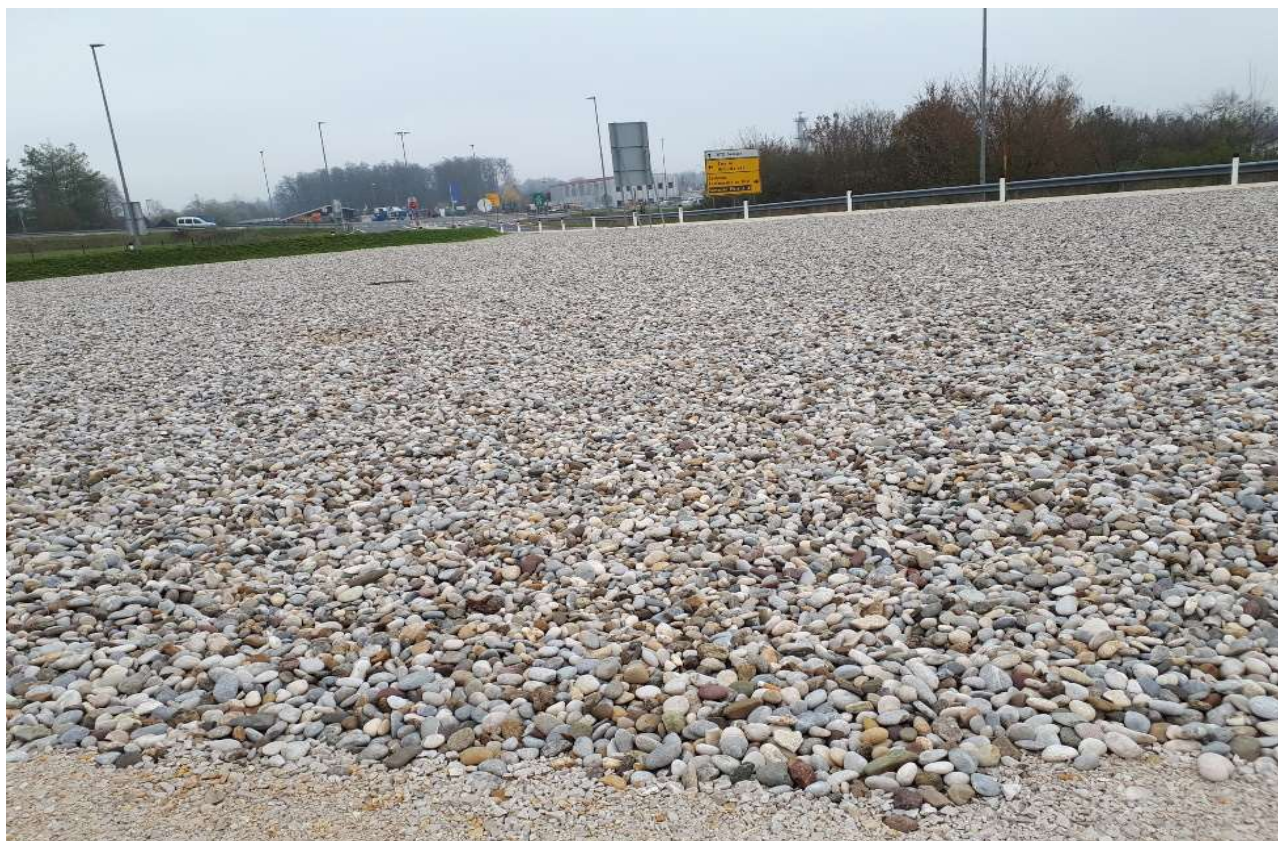
Slika 1: Primer izdelane izletne cone